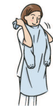
ガウンを首にかける